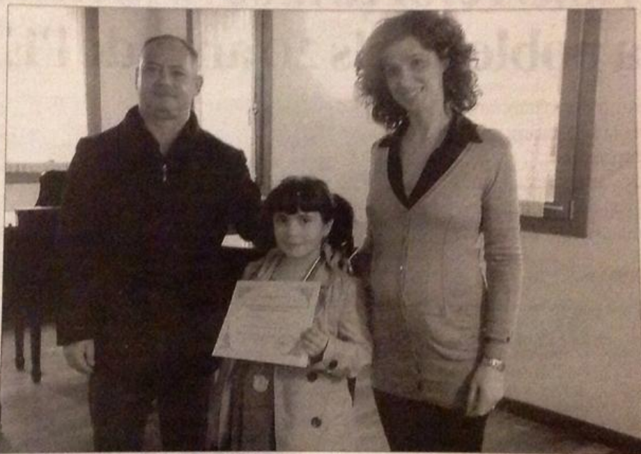
La joven músico con miembros del jurado del concurso italiano.

La joven ya tuvo su debut orquestal como solista acompañada por la Ariege Chamber Orches-