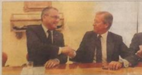
El alcalde y el consejero delegado de Metrovacesa se dan la mano.

La oposición se abstuvo en la votación P 16